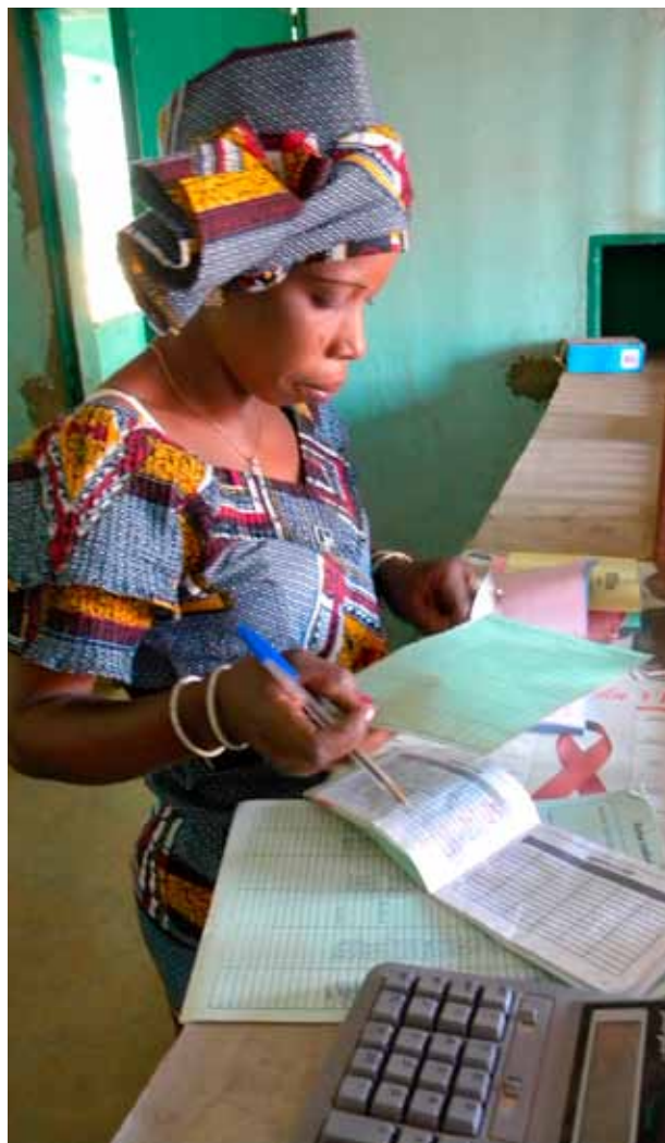
Les caisses rurales sont encore rarement informatisées (ici dans une caisse des U-BTEC au Burkina Faso).

Finrural (Bolivie) estime « que la régulation des taux devrait prendre en considération qu'il y a des institutions différentes sur le marché, avec des coûts d'opération différents, qu'il est fondamentalement distinct de servir un client au centre d'une ville et dans une zone rurale, qu'un client salarié n'a pas le même profil de risque qu'un petit producteur rural, que la technolo-